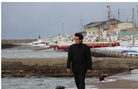
レポーターは“鮮魚一筋27年”の営業マン

今回のテーマは、“繋がり”。3月14日に延伸する北陸新幹線。北陸地方はより身近な存在になります。新潟、富山、石川の魚市場を鮮魚一筋の営業マンがめぐり、日本海の“海の幸”や、信州との食文化の繋がりをご紹介します。どうぞご覧ください。