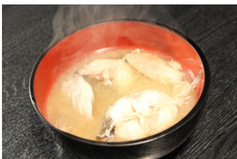
新潟県の名物「タラ汁」の甘～い味わい